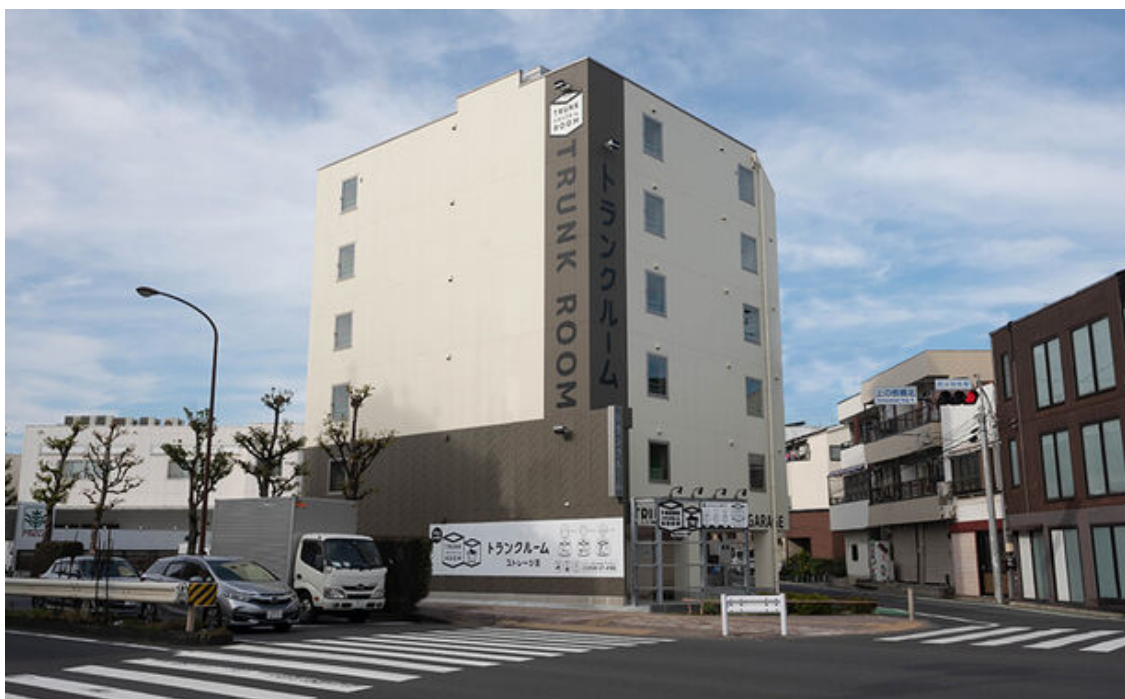
ときわ台トランクルーム外観