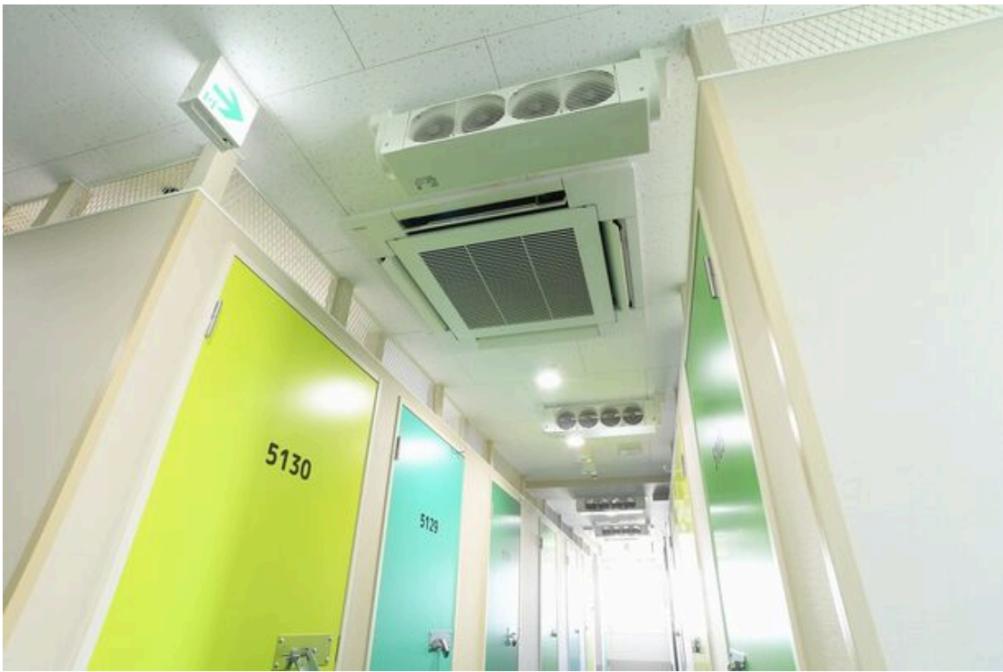
フロア空調及び換気システム