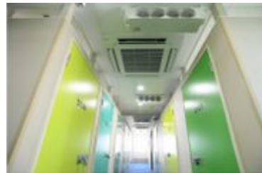
廊下から各部屋への