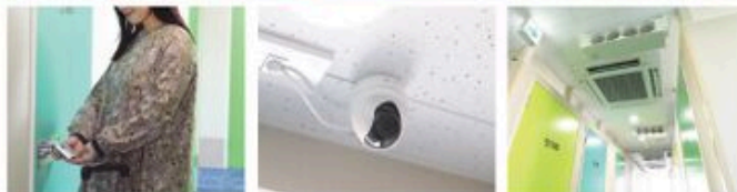
「ストレージ王」とまわらトランクルームはトランクルーム専用に開発された建物に建てられているので、出入り口がセキュリティ対策の徹底はもちろん、自動カメラが設置されていてセキュリティはばっちり。荷物も各階建てが人によって荷物設置されているので、自らの利用も安心です。また、フロア空調と換気システムも完備されているので、お部屋の心配がないのもポイント。