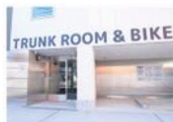
エントランス前には広い駐車スペースが確保されているので、大きな荷物もラクラク搬入。また、「タイムズカーシェアリング」との提携によるキャンペーンもあることで、自宅からトランクルームまでの移動に車を活用できるのも魅力です。

ができる理想的な保管場所。部屋の広さもロッカータイプから4畳を超える部屋まで、豊富なバリエーションがあるので、荷物の大きさや量に合わせて選べるのももちろん、24時間出し入れ可能というのもうれしいポイント。また、館内に直結した駐車スペースにまで屋根があり、雨の日も濡れずに荷物の搬入ができる。防犯カメラや火災警報器・清掃など、セキュリティ面もしっかりしていて、女性がひとりでも安心して利用できるのも大きな魅力です。 幅広く使い物置のような印象を大きく覆してくれた「ストレージ王」のトランクルーム。都会暮らしのベストウェイになりそうです。