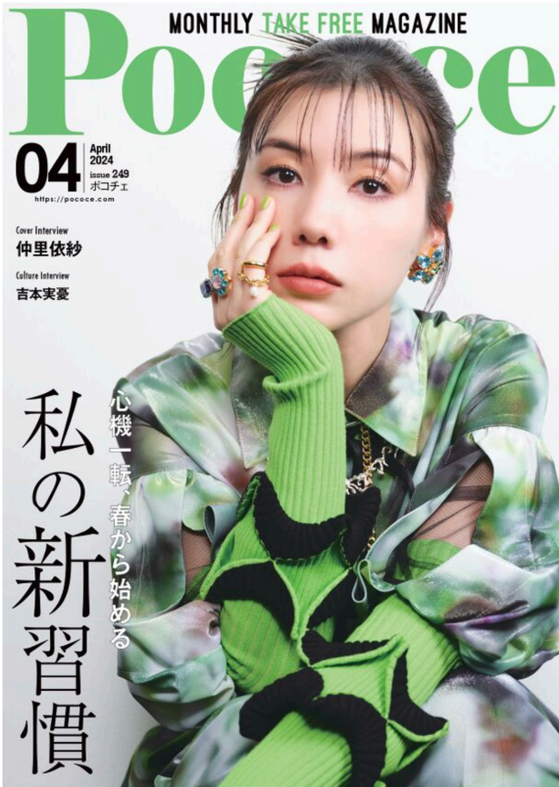
ポコチエ掲載表紙