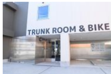
ときわ台トランクルーム入口