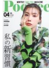
ポコチエ掲載表紙