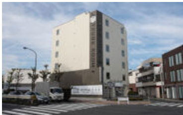
ときわ台トランクルーム外観