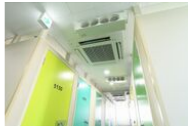
フロア空調及び換気システム