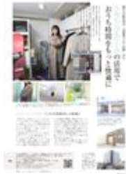
ポコチエ掲載記事